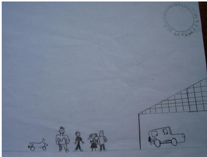
Figura 2- Desenho da Família (Participante 2)

Na figura 2 o participante 2 (P2) representou a mãe e os três filhos da família. Não representou a figura do pai e representou a si próprio de mãos dadas com a mãe o que sugere a sobrecarga no papel da mãe causado pela ausência paterna o que pode trazer prejuízo para o desenvolvimento do filho (Ferrari, 1999). Desenhou os personagens em tamanho proporcionalmente pequeno o que sugere vulnerabilidade e insegurança. A análise global pode ser verificada na tabela 3.