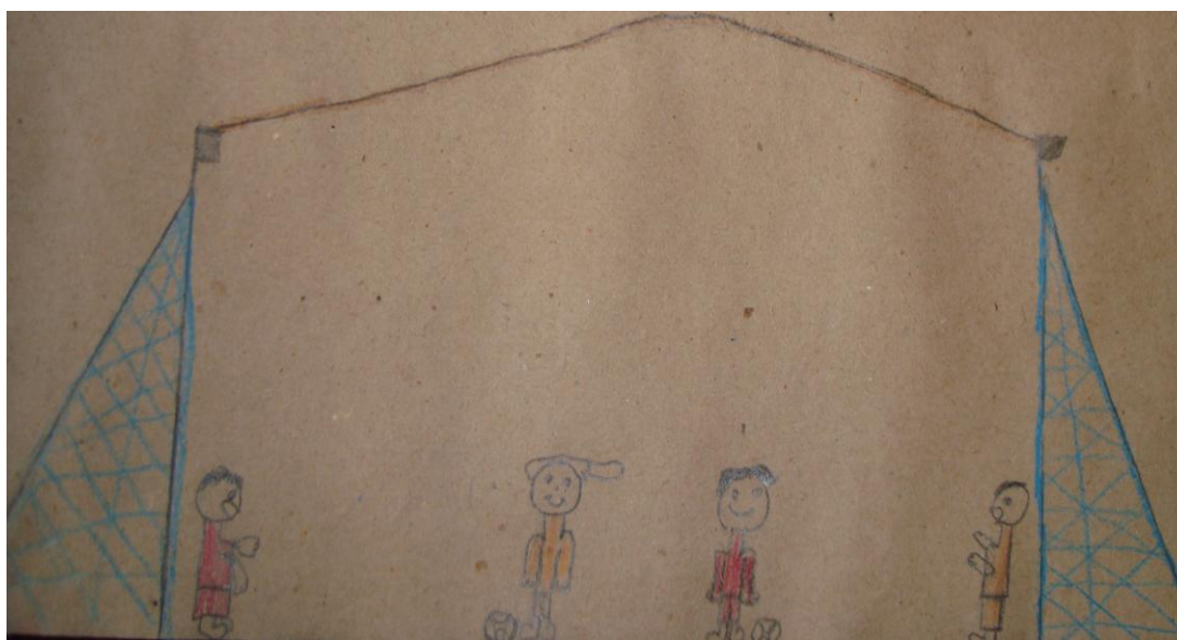
Figura 3- Desenho do Par Educativo (Participante 1)

As produções que representam o par educativo foram as seguintes: